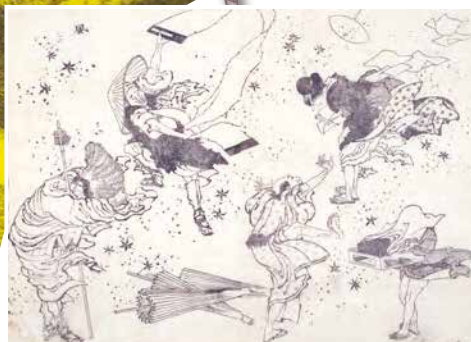
《風のいたずら》十二編