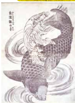
《魚籃観世音》十三編