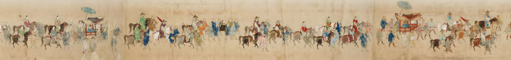
《朝鮮通信使給巻(上・下巻)(部分)》長崎県立対馬歴史民俗資料館蔵(重要文化財)複製展示