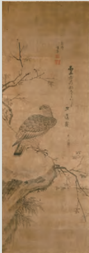
李義養筆《鷹図》釜山博物館蔵