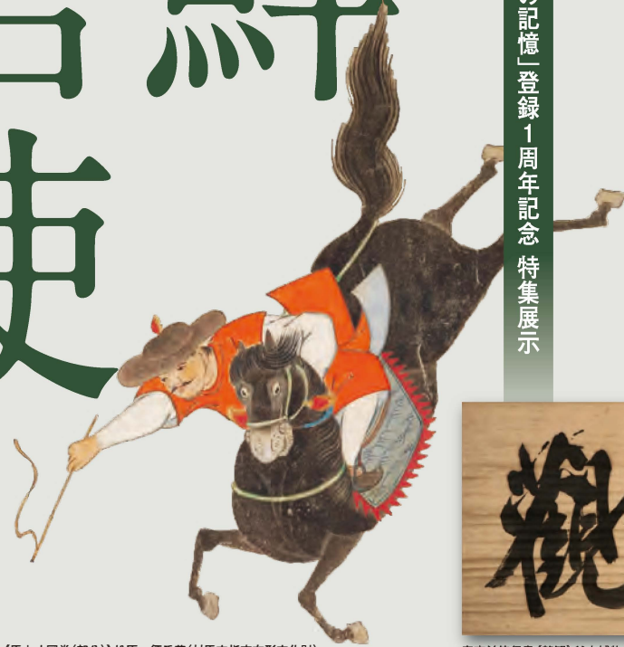
《馬上才図巻(部分)》松原一征氏蔵(対馬市指定有形文化財)