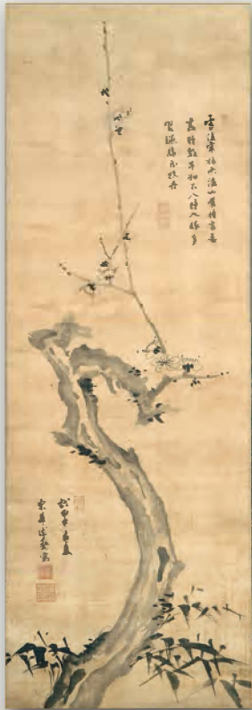
卡夏筆《墨梅図》釜山博物館蔵