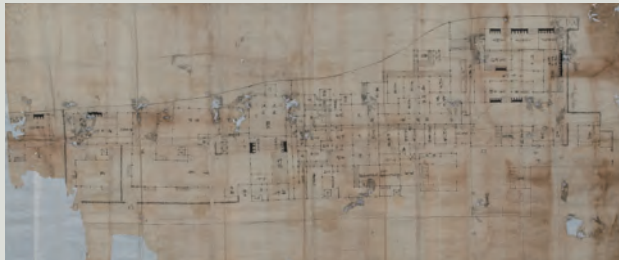
《朝鮮通信使迎接所絵図》 巻岐市蔵