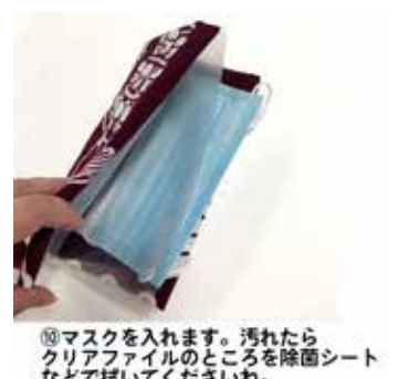
⑩マスクを入れます。汚れたら クリアファイルのところを除菌シート など拭いてください。