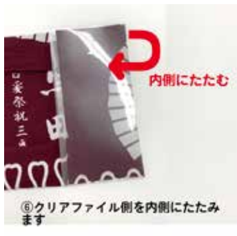
⑥クリアファイル側を内側にたたみます