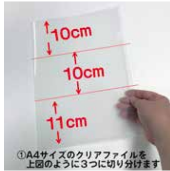
①A4サイズのクリアファイルを 上図のように3つに切り分けます