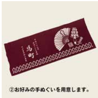
②お好みの手ぬぐいを用意します。