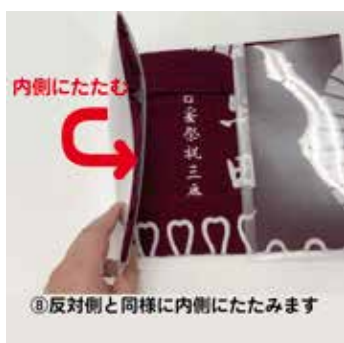
⑧反対側と同様に内側にたたみます