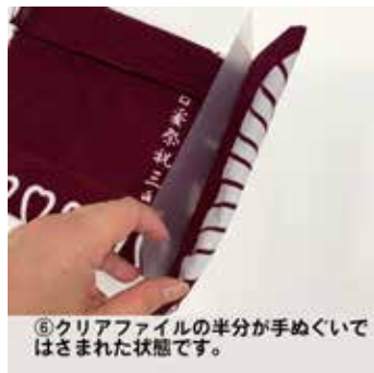
⑥クリアファイルの半分が手ぬぐいで はさまれた状態です。