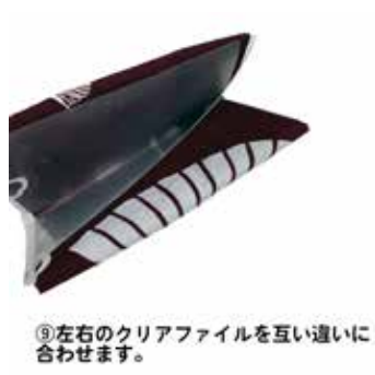
⑨左右のクリアファイルを互い違いに 合わせます。