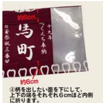
④柄を出したい面を下にして、 上下の端をそれぞれ6cmほど内側に 折ります。