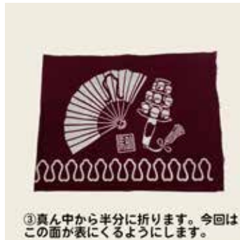
③真ん中から半分に折ります。今回は この面が表にくるようにします。