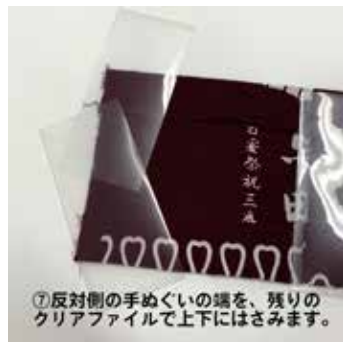
⑦反対側の手ぬぐいの端を、残りの クリアファイルで上下にはさみます。