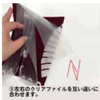
⑨左右のクリアファイルを互い違いに 合わせます。