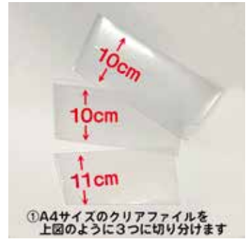
①A4サイズのクリアファイルを 上図のように3つに切り分けます