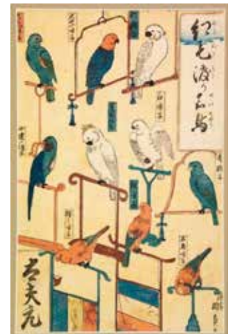
歌川国員「紅毛渡り名鳥」