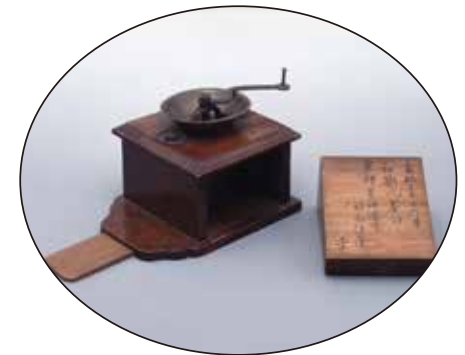
阿蘭陀茶臼 (コーヒーミル) おらんだちやうす