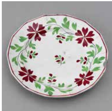
オランダ渡色絵花模様皿