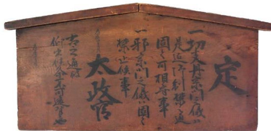
《キリシタン制札》当館収蔵