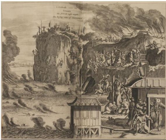
モンタヌス《日本遣使紀行》当館収蔵

本展示会では、禁教下の潜伏キリシタンの歴史について、幕末維新の頃を中心に、主に館蔵の文献資料の展示をもとに、わかりやすく解説します。第一に江戸幕府の禁教令以後におけるキリシタンの弾圧と潜伏について概観し、第二に幕末の長崎で起きた「信徒発見」と「浦上四番崩れ」について紹介し、第三に「浦上四番崩れ」後の信徒たちの浦上帰住について取り上げます。