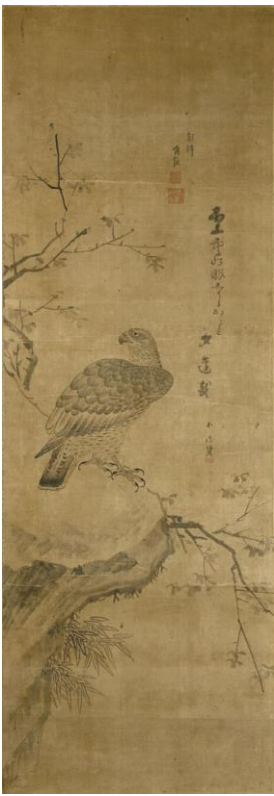
李義養筆《鷹図》釜山博物館蔵 複製展示

本展では、この登録から1年になることを記念し、長崎県や韓国に残る登録資料、周辺地域に残された朝鮮通信使関連の記録から、通信使を通して繰り広げられた交流の諸相をご紹介します。