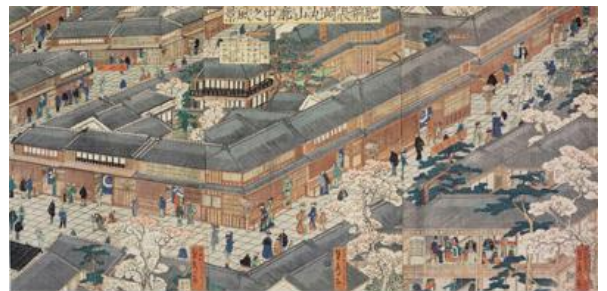
《肥前長崎丸山廓中之風景》(部分) 歌川貞秀画 長崎歴史文化博物館蔵

龍馬が生まれ活躍した幕末は、海外との新たな交流や国内の争いなどが起こり、大きく変化した時代でした。龍馬は時代の変化や京都、長崎で出会った多くの人々に影響を受けながら、時代を駆け抜けていったのです。長崎会場では、長崎にちなんだ資料も含め展示します。