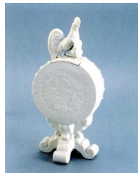
白磁太鼓形鶏紐付香炉 いずれも佐世保市教育委員会蔵

本展では佐世保市教育委員会と波佐見町教育委員会のご協力を得て、三川内焼約15点、波佐見焼約10点を展示・紹介します。