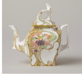
ローゼンブルフ《上絵花園ティーポット》岐阜県現代陶芸美術館蔵