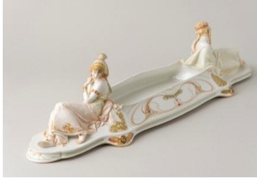
KPMベルリン《上絵金彩エジプト女性センターピース》岐阜県現代陶芸美術館蔵

さらに日本との結びつきを示す作品、および関連するリトグラフや素描、書籍を併せた約200点によって多彩な様相を紹介していきます。