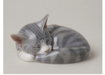
ロイヤル・コペンハーゲン《釉下彩眠り猫》塩川コレクション