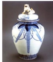
染付藤の花文沈香壺