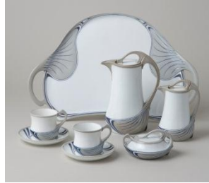
マイセン《釉下彩植物文デジュネ「サクソニア」》ロムドシン蔵