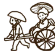
じんりきしゃ 人力車