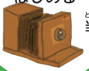
とうじ 当時のカメラ

しゅっちやう 出張さつえい サービスをはじめて だいせいこう 大成功! 1マスすすむ