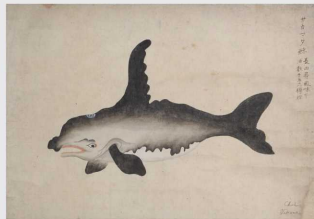
高野長英筆「サカマタ鯨図」(奥州市蔵)