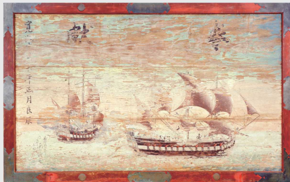
伝若杉五十八筆「蘭船図絵馬」(賀茂神社蔵)