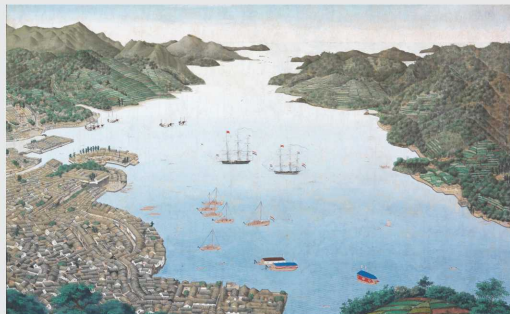
川原慶賀筆「長崎港図」(当館蔵)