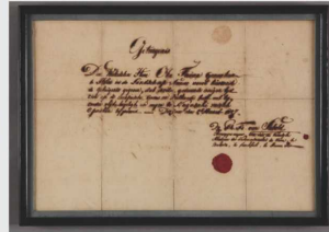
シーボルト医学証明書(早稲田大学図書館蔵)