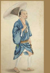
川原慶賀筆「Domestigrie (商家の使用人)／掛取人物図」 文久2年(1862)(当館蔵)

【ギャラリートーク】 日時/2023年10月21日(土) 11:00～12:00 2023年11月3日(金祝) 14:00～15:00 解説/当館研究員 参加費/無料(要展覧会チケット)