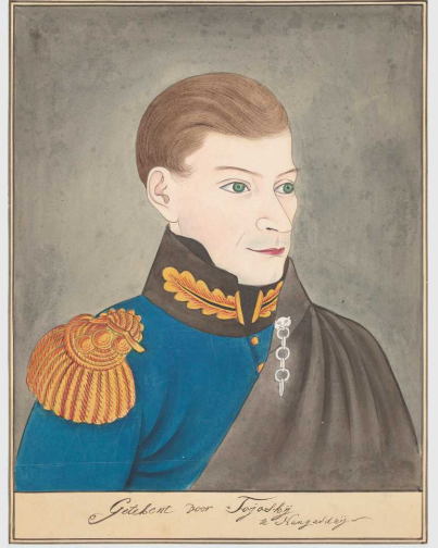
川原慶賀筆「シーボルト像」(歸空庵蔵)

若き日のシーボルトが目にした長崎、各地の風景とは。また、彼が出会い交流を深めた人々とは。本展では国内各地の門人や蘭学者、大名や通詞などシーボルトに関わった人々の資料、江戸との往復で訪れた地域に残る関係資料を通して、シーボルトの「足跡」をたどります。