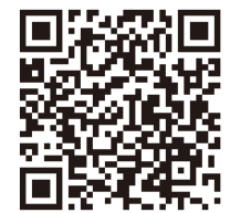
れきぶんの夏休み応募ページ

※応募フォームは Googleフォーム を使用しています。 ※フォームに入力後、Googleフォーム (forms-receipts-noreply@google.com) より 受付完了メール が届きます。 (こちらは参加当選通知ではありませんのでご注意ください)届かない場合はお電話でお問い合わせください。 ※各プログラムは 定員になり次第受付を終了 します。後日担当者から 参加のご案内メール をお送りいたします。