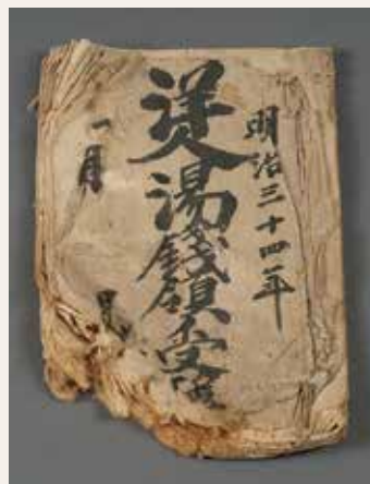
《洋人湯銭領受簿》1901年(明治34) 所蔵:雲仙湯元ホテル 雲仙で最も古い湯元ホテルが外国人向けに温泉の湯を販売した記録