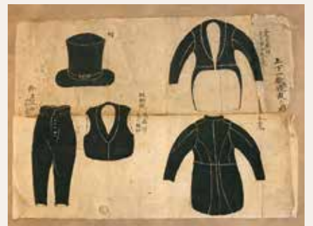
《上下一般禮服之図》江戸末・明治初期 所蔵:雲仙湯元ホテル 外国人観光客接客時の服装参考図